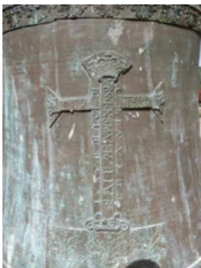
Cruz de San Benito en un esquilón de la iglesia parroquial de Carrascal de la Cuesta, fundido en 1786.

En los últimos años, la cruz de calvario ha sido sustituida por crufijos en bajorrelieve o por ángeles en actitud reverente y orante.