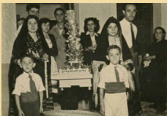
Fotografía de portada: Los Cirios , 1948. Libro del IGH "Una mirada al ayer". Santa María la Real de Nieva, 2014.