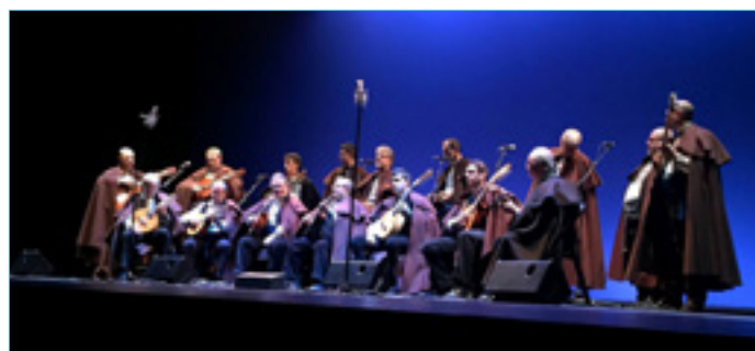
La Ronda Segoviana. Concierto 2015.

Abriendo el siglo XXI, el disco monográfico Rondas de boda se editó en 2002, regresando a la razón de ser de la agrupación musical, las rondas, reuniendo canciones que se vinculan con los preparativos y la celebración del rito de matrimonio. Cinco años más tarde, ya en 2007, llegó hasta el público el disco Canciones de Navidad , con el fin de plasmar distintos villancicos, entre ellos, algunos de los recogidos tanto por Agapito Marazuela como por Mariano y Félix Contreras en sus respectivos Cancioneros.