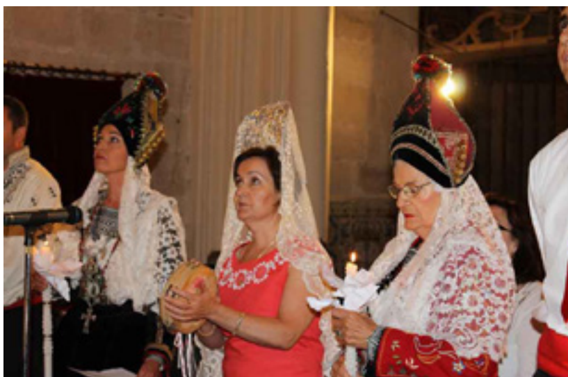
Arriba: Ofrecimiento de los Cirios, 1948. Imagen publicada en el libro dedicado a Santa María en la serie "Una Mirada del Ayer". Diputación de Segovia, 2014. Abajo: Cantadora y Pedidoras de la Calle Ochando.