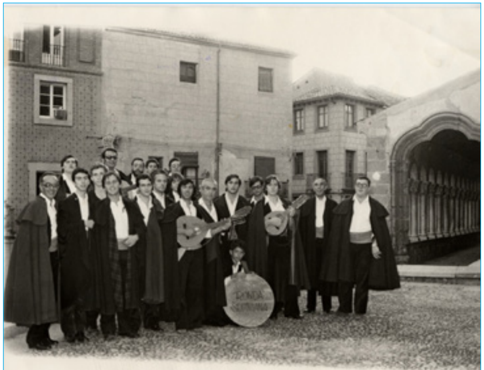
La Ronda Segoviana en la Plaza de San Martín. Años 80.