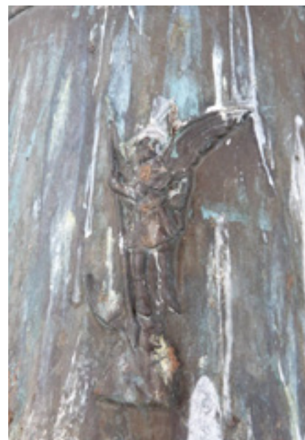
Efigie de San Miguel Arcángel en la campana mayor de la iglesia de La Cuesta, fundida en 2004.

En otros casos, ese carácter apotropaico se consigue con otras representaciones religiosas. La cara anterior de la campana mayor de la iglesia de La Cuesta posee grabado un molde de San Miguel Arcángel pisando la cabeza a Lucifer 8 .