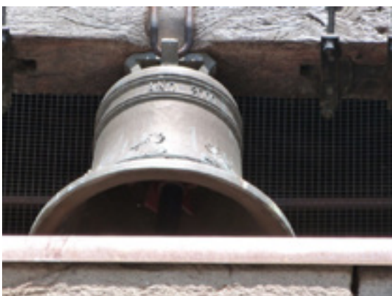
Esquilón de la iglesia parroquial de Losana de Pirón, fundido por Caresa, S. A. en 2000.

La campana, considerada un vaso sagrado, debía ser bendecida para su utilización por el Ordinario diocesano o por alguien en que delegase (normalmente, el arcipreste o el párroco titular). Uno de los motivos decorativos que utilizaron los maestros campaneros fueron cálices, copones y custodias de sol, todos ellos vasos sagrados utilizados en la liturgia eucarística. Se podría hablar de una decoración metalingüística sobre la campana: vasos decorando a un vaso mayor; o lo que es lo mismo: la decoración «metacampana».