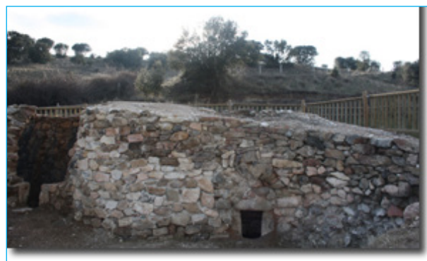
Hornos de Cal del Zanco. Página web Ayuntamiento Vegas de Matute.

E l noveno mes del calendario y la festividad del alado San Miguel Arcángel, el día 29, marcan el final del estío festivo... Se cierra así un ciclo en el que las Fiestas del Teo y el Santo Cristo del Caloco (en el Espinar) o las del Santo Cristo de la Expiración (en Nava de la Asunción) se prolongan durante más de siete días... y con ellas, las celebraciones de la Natividad de la Virgen bajo distintas advocaciones (en numerosos pueblos de la Sierra, Carbonero el Mayor, Riaza, Santo Tomé del Puerto...), el Dulce Nombre de María (Turégano), La Exaltación de la Cruz (muy diseminada), El Henar (Cuéllar), San Miguel Arcángel (en Sebúlcór) o la Virgen de los Remedios (en Abades, Cobos de Segovia o Castroserna de Abajo).