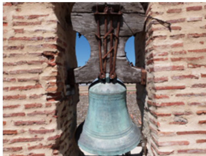
Esquilón de la iglesia parroquial de Otones de Benjumea construido por Paulino Linares en 1891.

Por último, hay que incluir las devociones locales. En el caso de Otones de Benjumea, las dos campanas esquilonadas que se conservan en la espadaña de su iglesia parroquial, fundidas por Paulino Linares en 1891 y Serafín Güemes en 1940, están dedicadas al santo titular de la parroquia y patrón de la localidad: San Benito Abad. O, en el caso de Torrecaballeros, una campana de la pareja de romanas que conserva dicho campanario (elaboradas por Casa Cabrillo en 1950) está dedicada a San Nicolás de Bari, titular de la parroquia.