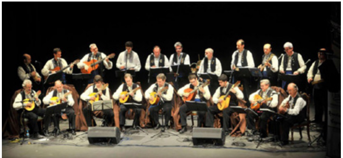
La Ronda Segoviana en uno de sus conciertos del año 2014.

Presidente de la Ronda Segoviana y miembro del Consejo Asesor del IGH