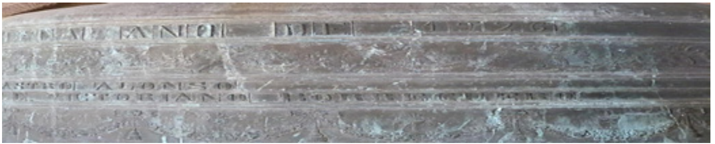
Detalle de la guirnalda y vasos sagrados, en el esquilón grande de la iglesia parroquial de Santiago de Turéganom fundido por José Cabrillo en 1926.

En el siglo XX, las campanas fundidas por José Cabrillo Mayor, de Salamanca, (fundidor de la Casa Real) y Serafín Güemes Falla, de Bareyo (Cantabria), utilizan profusamente vasos sagrados en todas las composiciones decorativas de los bronce estudiados. Las campanas mayores de Santiago de Turégano y Sotosalbos, de Cabrillo, presentan una guirnalda a lo largo del tercio en cuyos vanos se puede observar una serie que consta de custodia de sol, cáliz y copón. En las campanas de Güemes (La Cuesta, Torreiglesias, Turégano y Veganzones) Todos estos moldes citados pueden ser interpretados como muestra de la vertiente sagrada que tiene el bronce destinado a los usos religiosos.