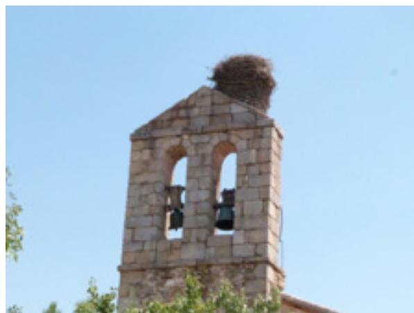
Arriba: Campana romana de Adrada de Pirón (1796). Abajo: Espadaña de la iglesia parroquial de Tenzuela.