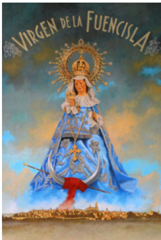
Arriba: Cartel conmemorativo del Centenario de la Coronación, 2016. Dibujo de J. L. López Saura. Bastón de mando y fajín rojo a sus pies, como Capitana Generala. Abajo: Una toma de 1916.