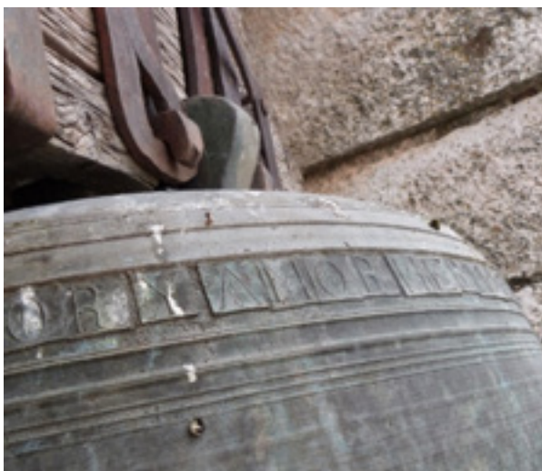
Moldes tipográficos decorados. Campana mayor de la iglesia parroquial de Torreiglesias, fundida en 1900.