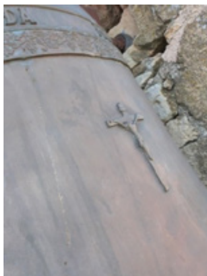
Campana mayor de la iglesia parroquial de Brieva, fundida por Caresa S. A. en 2001.

En los últimos años, la cruz de calvario ha sido sustituida por crufijos en bajorrelieve o por ángeles en actitud reverente y orante.