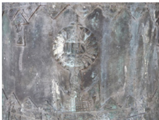
Caballar, 1862.